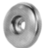
Pokrywa obudowy: stal kwasoodporna 1.4301