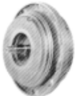
Tarcza mocująca silnika: żeliwo GG20 Wał pompy: stal kwasoodporna 1.4305