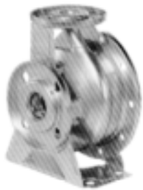
Obudowa pompy: stal kwasoodporna 1.4301