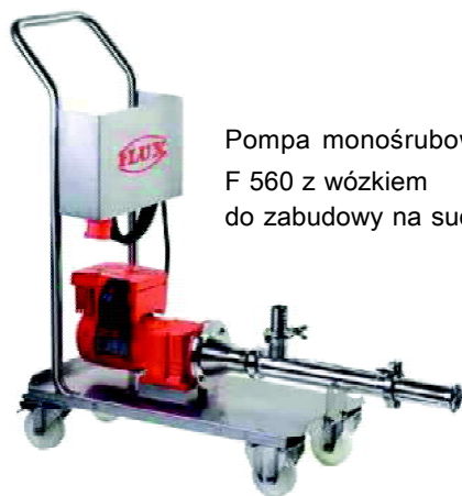
Pompa monośrubowa F 560 z wózkiem do zabudowy na sucho